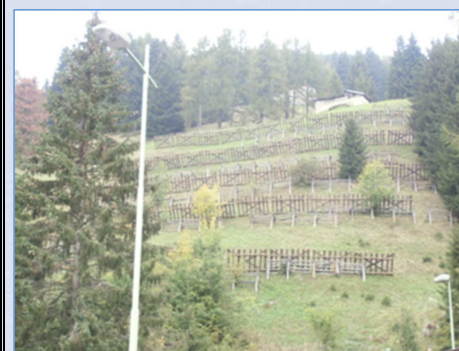
Vista d'insieme da valle dell'intervento