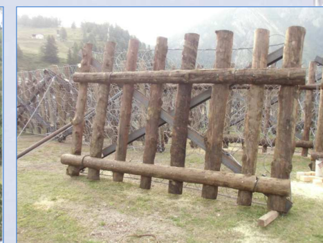
Dettaglio elemento "VELA-Fermaneve"