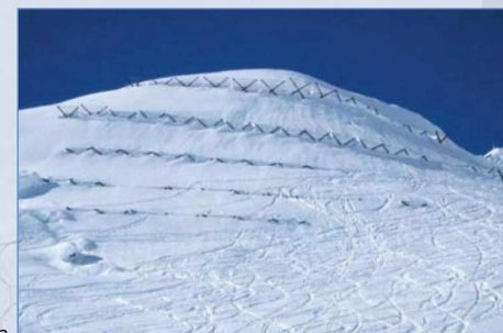
Vista d'insieme dell'intervento dopo la nevicata