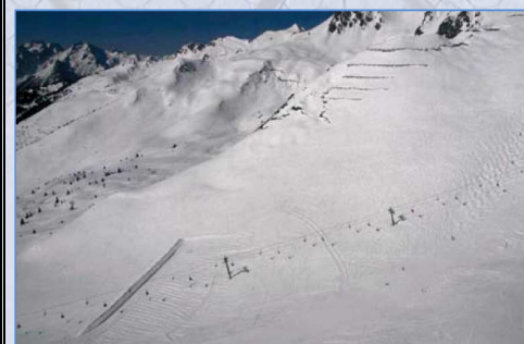
Vista d'insieme della Ski area dopo la nevicata